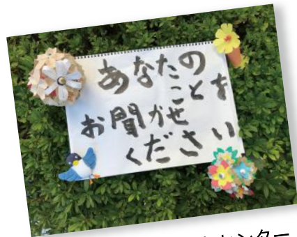
上馬あんしんすこやかセンター

世田谷区内の、支え合う地域の仲間たちから、認知症の人や家族へのメッセージを一冊のスケッチブックでリレーしていくコーナーです。あなたのまちの仲間も登場します。